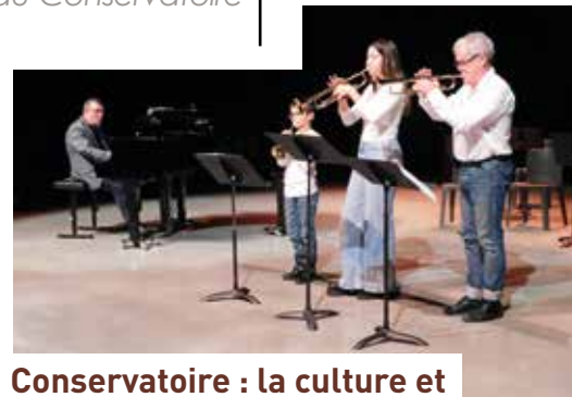
Conservatoire : la culture et l'apprentissage accessibles à tous

Au cœur de son projet pédagogique, l'accès à la culture musicale s'est développé ces derniers mois avec la création d'une nouvelle saison artistique du Conservatoire dans la salle du Moulin Saint-Julien. L'occasion pour les élèves et professeurs de faire découvrir leurs savoirs-faire, mais aussi au public d'avoir accès gratuitement à des concerts de qualité.