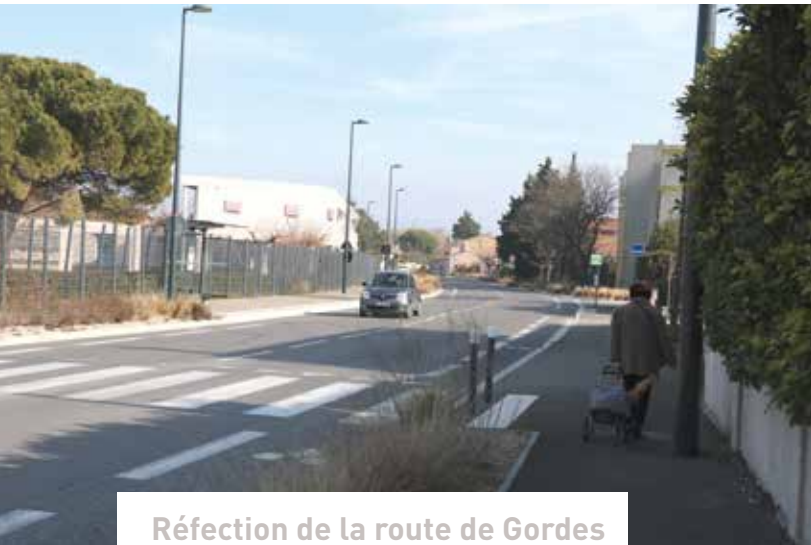
Réfection de la route de Gordes

Les travaux ont consisté en l'élargissement et la normalisation PMR des trottoirs, l'aménagement des quais de l'arrêt de bus de la ligne B, la création d'une piste cyclable de 1.50 m de part et d'autre de la voie, l'installation d'un plateau traversant à l'intersection de l'avenue Elsa Triolet et de la route de Gordes, ainsi qu'en l'aménagement d'espaces verts le long de la voie, la plantation d'arbres et de végétaux de taille moyenne. Un giratoire a été implanté à l'intersection de l'avenue Georges Pompidou et de la route de Gordes afin de réduire la vitesse et de sécuriser le carrefour.