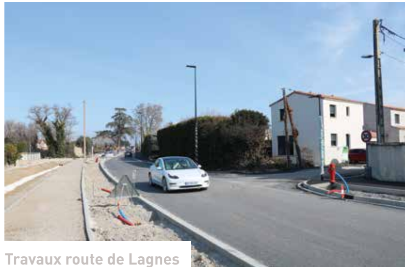
Travaux route de Lagnes

Les travaux ont consisté en l'élargissement et la normalisation PMR des trottoirs, l'aménagement des quais de l'arrêt de bus de la ligne B, la création d'une piste cyclable de 1.50 m de part et d'autre de la voie, l'installation d'un plateau traversant à l'intersection de l'avenue Elsa Triolet et de la route de Gordes, ainsi qu'en l'aménagement d'espaces verts le long de la voie, la plantation d'arbres et de végétaux de taille moyenne. Un giratoire a été implanté à l'intersection de l'avenue Georges Pompidou et de la route de Gordes afin de réduire la vitesse et de sécuriser le carrefour.