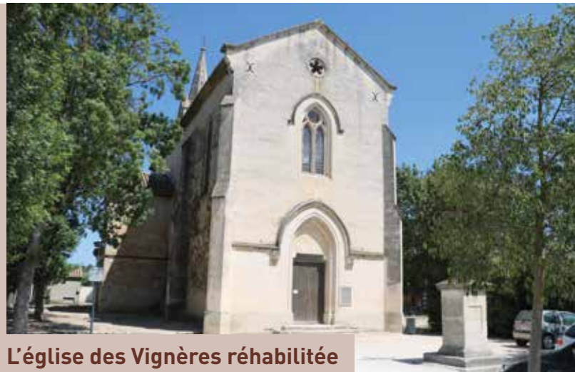
L'église des Vignères réhabilitée

Héritage du passé, le patrimoine est le témoin de l'histoire dans le monde actuel. La vie culturelle doit être accessible à tous, aussi la Ville de Cavaillon a souhaité engager des travaux à l'église des Vignères et à la Scène nationale La Garance. L'accès à la culture continue de se démocratiser au Conservatoire de musique et à l'espace Léon Colombier.